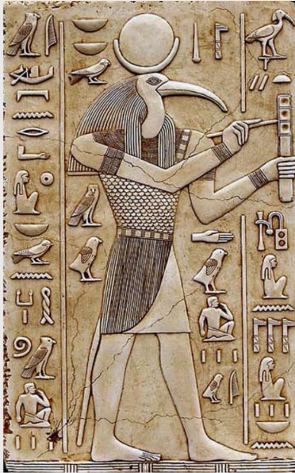
Бог Тот, барельеф гробницы Хоремхеба

* Тот или Джехути, в египетской мифологии бог луны, мудрости, счета и письма, покровитель наук, писцов, священных книг, создатель календаря. Женой Тота считалась богиня истины и порядка Маат. Священными животными Тота были ибис и павиан, и поэтому бога часто изображали в виде человека с головой ибиса, иногда с папирусом и письменным прибором в руках. Тот, отождествляемый с луной, считался сердцем бога Ра и изображался позади Ра-солнца, поскольку слыл его ночным заместителем. Тоту приписывалось создание всей интеллектуальной жизни Египта.