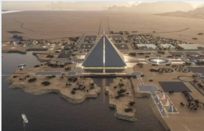
Фото с планом города:

10:10 - сообщение от подписчицы (Ольги из Вьетнама) о воздвигнутом новом городе в Египте. - Этот город точно не для людей, а центре возвышается пирамида в 650 метров (муравейник без окон, без дверей).